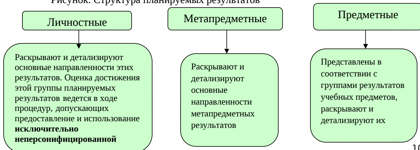
Рисунок. Структура планируемых результатов

Планируемые результаты опираются на ведущие целевые установки , отражающие основной, сущностный вклад каждой изучаемой программы в развитие личности учащихся, их способностей.